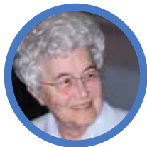
► Chiara Lubich

Ez volt mozgalmunk egyik szenvedélye már kezdettől fogva, hogy életével, szavaival, művészetével hirdesse: Isten nemcsak Igazság és Jóság, hanem Szépség is.