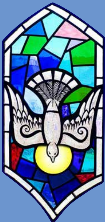
St. Macartin's Cathedral, Enniskillen, County Fermanagh, Northern Ireland