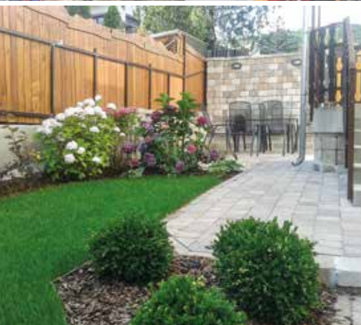
Fotó: Prokopp András albumából (2)

hogy megvárjuk a telet, mert olyankor mindig szokott roskadni a föld, és majd tavasszal jelentkezem. Pár hete felhívtam őket, hogy mit tehetek, és a megrendelő megköszönte, hogy nem felejtettem el. Talán azt gondolta, hogy eltűntem, és ez a munka nem lesz teljesen befejezve. Hajlottam arra, hogy hagyjam az egészet, de úgy éreztem, vállalnom kell. Végül megbeszéltük, hogy majd ősz elején visszatérünk rá, és megcsináljuk.