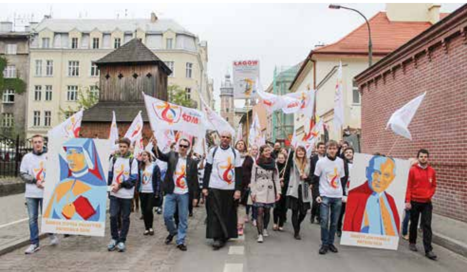
Facebook / World Youth Day (3)