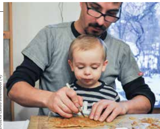
Brzózka család albumából (4)

Marek: Annyira konkrét is lehet a segítség, hogy például egyikünk elmosogat, hogy a másiknak időt nyerjen. Mi nem kiemelkedünk a művészetből, hanem belefolyik a hétköznapjainkba és teljesen átjárja. A legnagyobb veszedeéseink végén például elkezdjük a másik