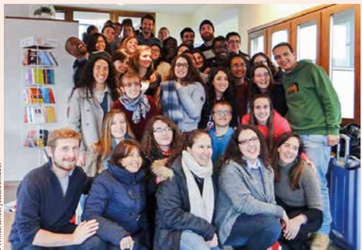
a Winterschool fotóalbumából

Interdiszciplináris és interkulturális jellegéből eredően a kurzus a résztvevők számára lehetővé tette, hogy reflektáljanak, mintegy a gyakorlatban is megtapasztalják és megértsék az egység kultúrája alapvetését, amelyet a Sophia akadémiai szinten is közvetíteni kíván. A Trentóban eltöltött intenzív egy hét, az előadások, a véleményserék mind az előadókkal mind pedig a résztvevőkkel, a különböző kontinensekről érkezett fiatalokkal való barátságok, a különböző sportprogramok együttesen hozzájárultak ahhoz, hogy ne csak egy hét erejéig érezzük, mondjuk, mondhassuk magunkat Sophiás diáknak. ■