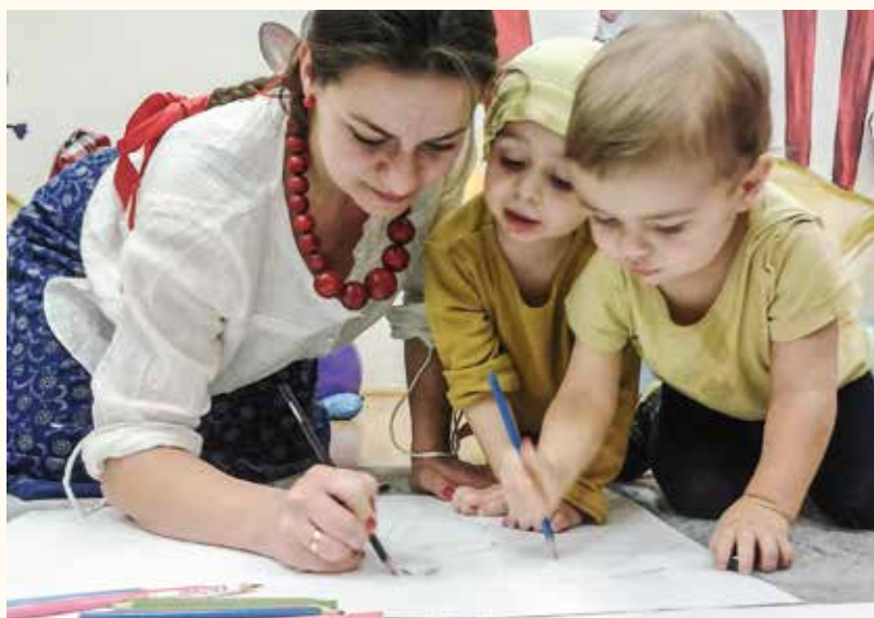
Brazília családját albumából