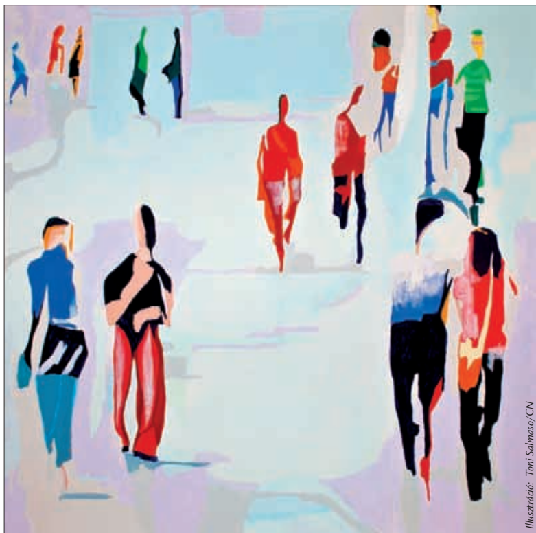
Illusztráció: Tomi Salmaso/CN

Sok olyan mester van, akik könnyű megoldásokra és megalkuvásra hívnak. Mi az egyetlen Mestert akarjuk hallgatni és követni, mert csak Ő mondja ki az igazat, és csak neki vannak „örök életet adó igéi”. Így mi is elismélhetjük Péter szavait.