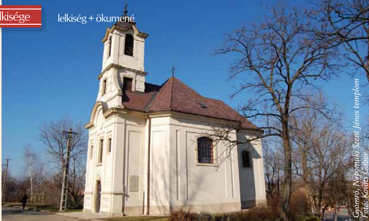
Gyömrő, Nepomuki Szent János templom