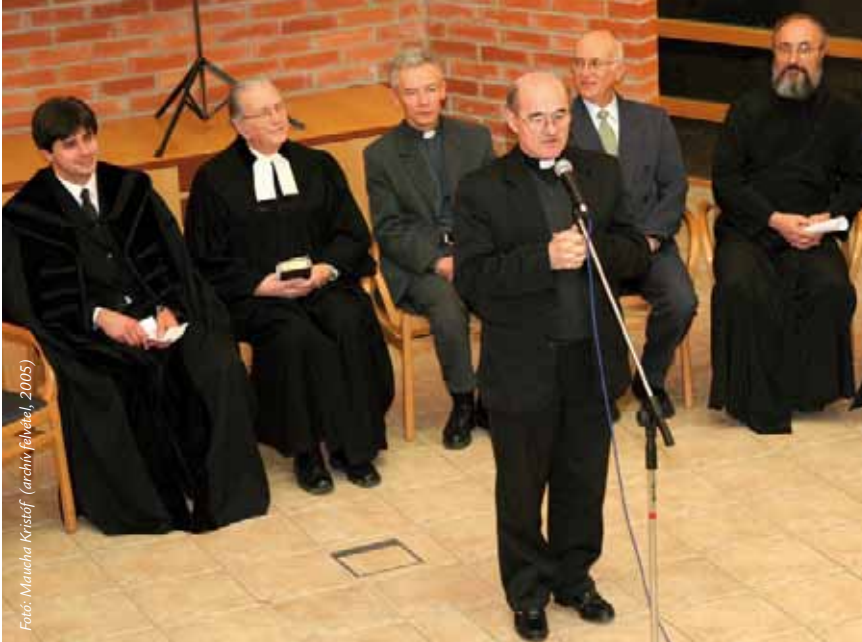
Fotó: Mancha Krístof (archív felvétel, 2005)