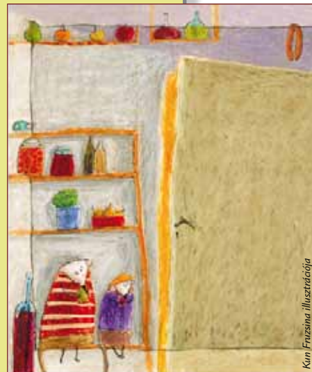
Kun Fruzsina illusztrációja

A kopasz király és más mesék című gyűjtemény december második felében került a könyvesboltok polcaira, mely igényes külsővel, gyönyörű belső rajzokkal kelti életre Nagy Olga történeteit.